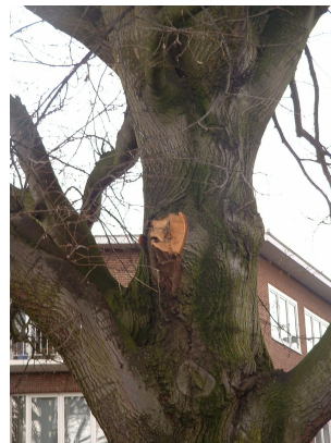
, 27 Février 2006