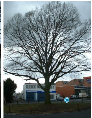
, 27 Février 2006