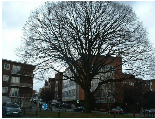
, 27 Février 2006