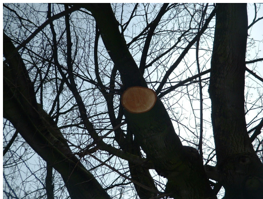
, 27 Février 2006