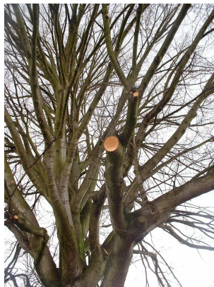
, 27 Février 2006