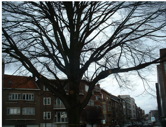
, 27 Février 2006