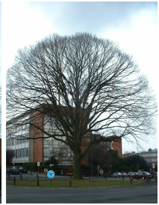
, 27 Février 2006